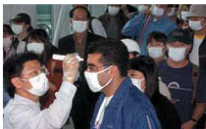
アジアの空港での使用

サーモフォーカスプロは、電源のオフが設定できます。使用後に電源をオフにするか、或いは使用後約4時間で電源をオフにするかを設定でき、電源を節約します。